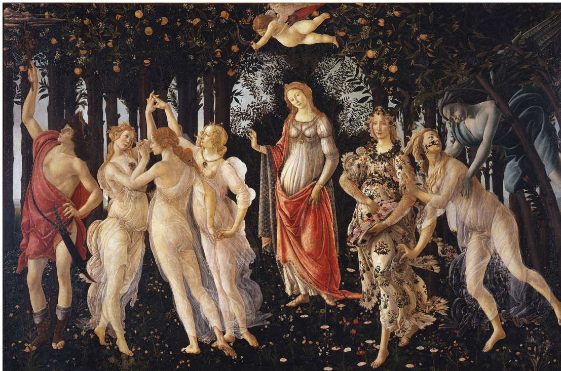
Sandro Botticelli, Primavera, um 1482/87, Florenz (Uffizien)

Gleichzeitig war die Auftragserteilung auch ein Teil der mediceischen Kunstpolitik: wurde doch damit für alle deutlich signalisiert, welch hohen Stellen- und Repräsentationswert die Kunst für die Familie Medici hatte. Ganz Florenz sollte gezeigt werden, welches großartige Kunstmäzenatentum die Medici betrieben. Dabei war es auch von entscheidender Bedeutung,